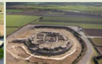
Vista aèria de la fortalesa dels Vilars d'Arbeca. Arbeca.