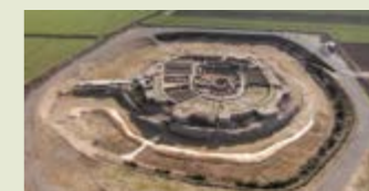
— Vista aèria de la fortalesa dels Vilars d'Arbeca. Arbeca.