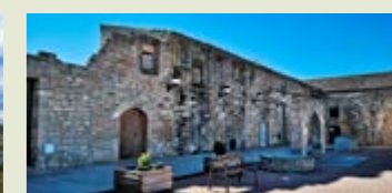
— Castell - palau d'Aspa, a l'espai del mirador de la vall del Set.