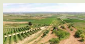
— Ruta de la Serra - Tossals de Torregrossa