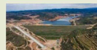
— Pantà de l'Albagés, que recull les aigües del riu Set i del Canal Segarra-Garrigues.