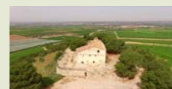
— Ruta de l'Embassament d'Utxesa