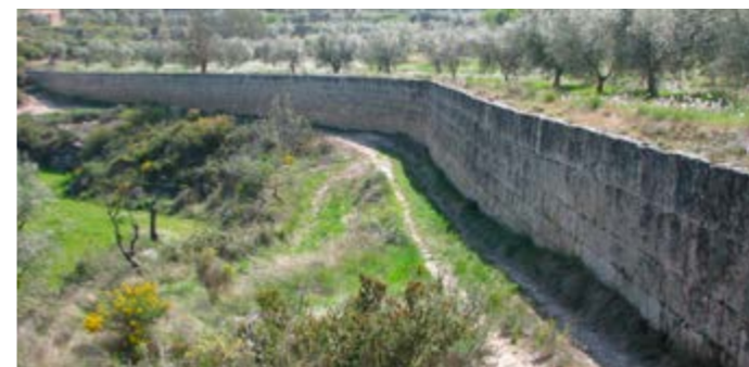
Construcció monumental Marge del Bessó

Les pedres foren transportades amb tirapedres arrossegats per mules. Va ser construït del 1921 al 1927 pels tres germans de Cal Blanco. Té una longitud de 128 metres, una alçada que arriba fins als 4 metres i una superfície total de mur que arriba vora els 400 m 2 . Podria pesar més de 400 tones. El marge és de tipus escalonat; cada filada està perfectament delimitada i reula uns quants centímetres respecte de l'anterior. Els carreus tenen un gruix i una forma similars, amb un encaix quasi perfecte, i estan col·locats a trencajunts.