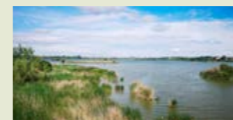
— Estany d'Ivars i Vila-sana.