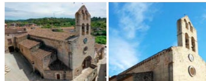
Vista general i detall de l'Església de Sant Joan Baptista.

La van bastir, amb la mateixa pedra de Vinaixa, picapedrers del poble i de localitats veïnes, i s'alça sobre un turó de roca de conglomerat massís. L'any 1980 va ser declarada monument historicoartístic pel Ministeri de Cultura. Llueix una reproducció a mida real del retaule dels sants Joans.