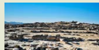
— Poblat Ibèric de Gebut. Soses. Fotografia: Jordi Seró. INSITU Patrimoni i Turisme.