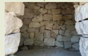
Forn de calç. Tarrés