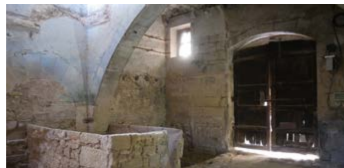
Entrada de la Casa de Poblet

Recentment s'ha restaurat i rehabilitat tornant a l'estat original del segle XIX.