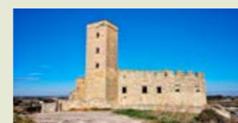
— Castell de Ciutadilla.