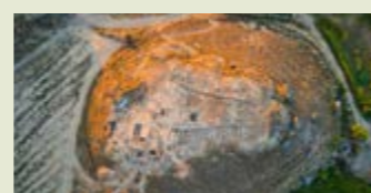
— Poblat Ibèric de Gebut. Soses.