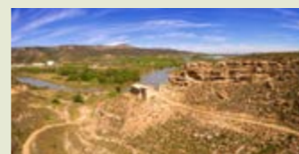
— Ermita de Sant Jaume, amb el riu Segre de fons. La Granja d'Escarp.