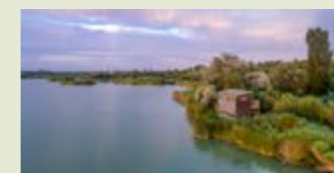
— Estany d'Ivars i Vila-sana.