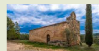
— Santa Maria de les Besses. Cervià de les Garrigues.