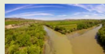
— Aiguabarreig del riu Segre (dreta) amb el riu Cinca (esquerra). Massalcoreig / La Granja d'Escarp.