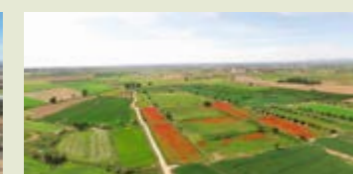
— Ruta de la Serra - Tossals de Torregrossa