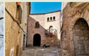
Carrer del nucli antic dels Omellons.