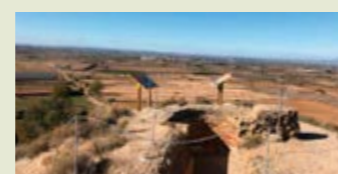
— Ruta de la Serra - Tossals de Torregrossa