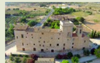
Castell de la Floresta. La Floresta.