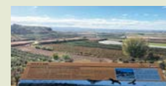
— Ruta de la Serra. Mirador de la Carrerada